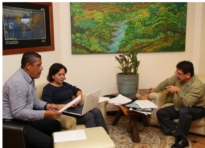
▲ Paraguay y Honduras