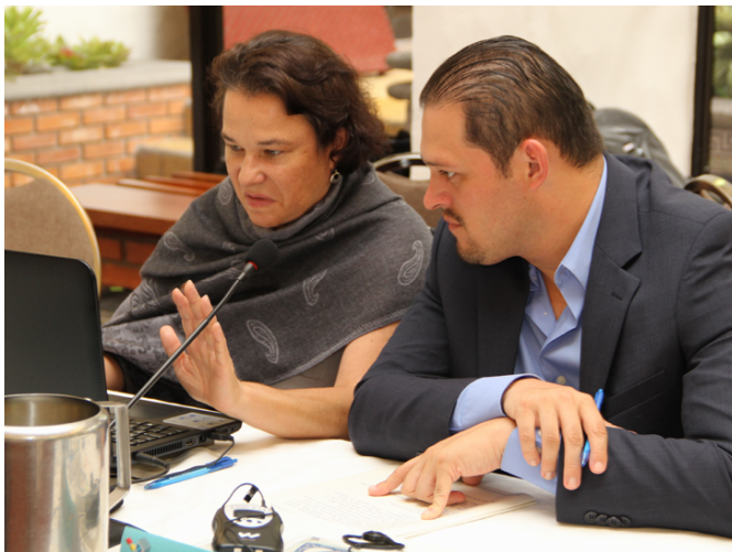
▲ Costa Rica