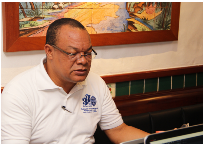
▲ República Dominicana