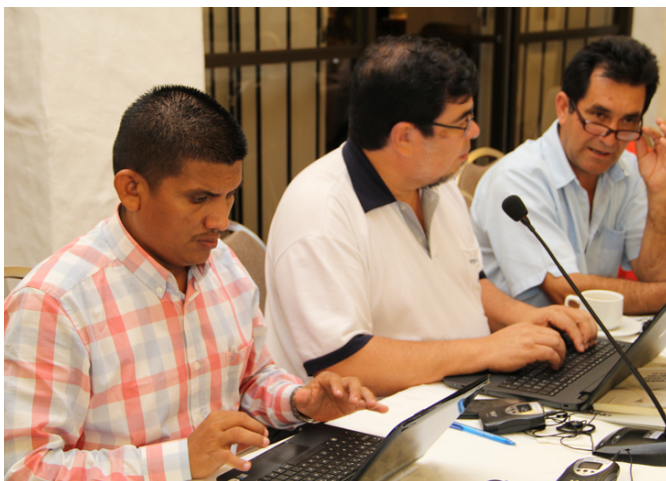
▲ El Salvador